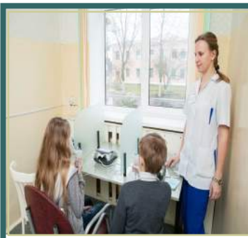
Имеется мини- бассейн.

Один из основных факторов оздоровления обучающихся и формирования у них культуры питания — организация качественного пятиразового питания с использованием современных методик детской диетологии. На пищеблоке работают высококвалифицированные специалисты, используется современное оборудование